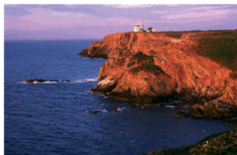
Beg Melen - pointe jaune en breton - Ile de Groix (Morbihan)