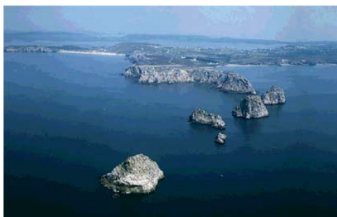
Les Tas de Pois (Finistère)