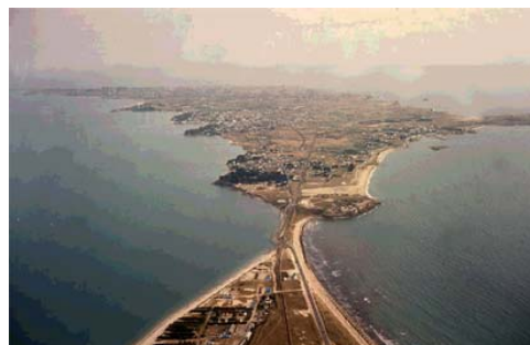
Presqu'île de Quiberon (Morbihan)