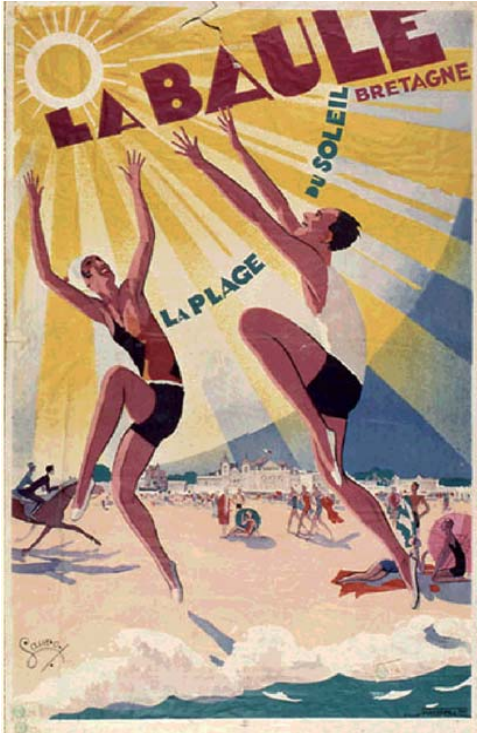
La plage du soleil (1930). Affiche de Sauro, Musée des Ducs de Bretagne, Nantes.