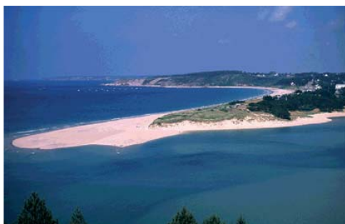
Sables d'Or les Pins (Côtes d'Armor) M. Rapillard

► A l'aide d'une carte de la Bretagne, localise chacune d'entre elle et indique à côté ou en dessous quel nom on pourrait donner à ce genre de côte (plage de sable, de galets, côte rocheuse, falaise, isthme, flèche de dune, ...).